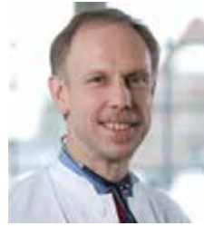
Chefarzt der Fachabteilung Innere Medizin, Rheumatologie, Klinische Immunologie und Osteologie am Immanuel Krankenhaus Berlin

Liebe Kolleginnen und Kollegen, sehr geehrte Damen und Herren,